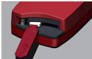
La Cleaner'en ligge i 10 minutter før rengjøring