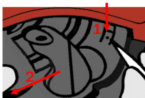
Løsne opp kyvetteholderen